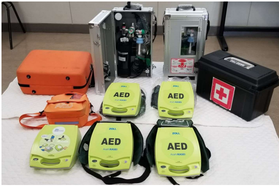
所有するAED、人工呼吸器、救急用品等