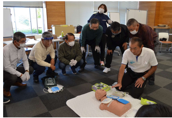
AEDの取扱い訓練状況