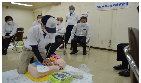
AED取扱いによる救命講習