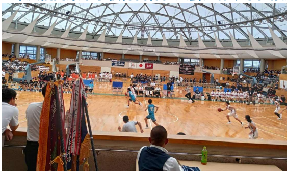
バスケット競技大会での救護活動(2023.7)