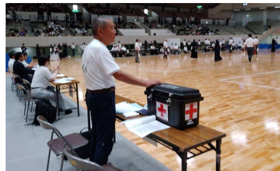
剣道大会での救護活動(2023.7)

☆ 1回のイベント派遣料は原則として2人1組(人工呼吸器、AED、救急用品携行)で3万円です。イベントの時間、規模により派遣人員、費用が変わりますのでご相談ください。